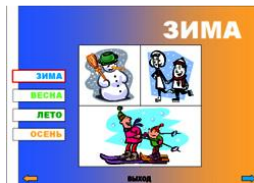
Рис.2. Слайд 2.