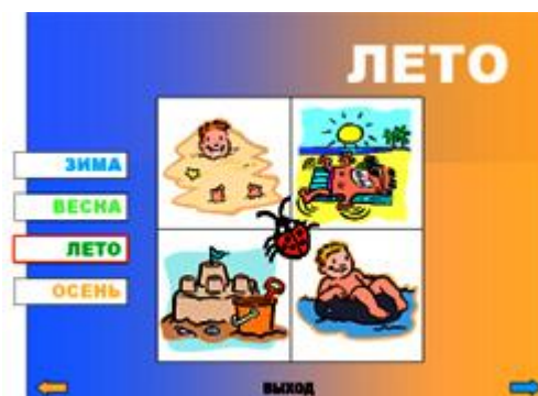
Рис.4. Слайд 4.