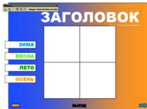
Рис.7. Образец слайдов