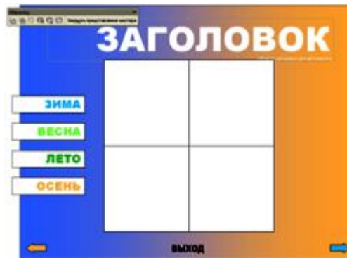
Рис.7. Образец слайдов