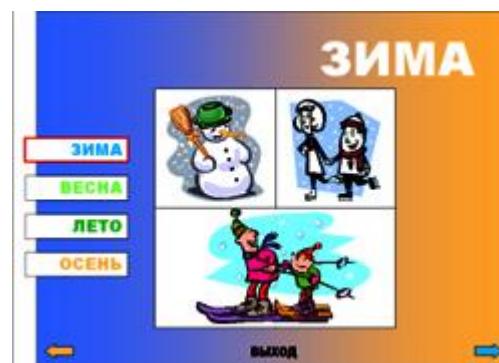
Рис.2. Слайд 2.