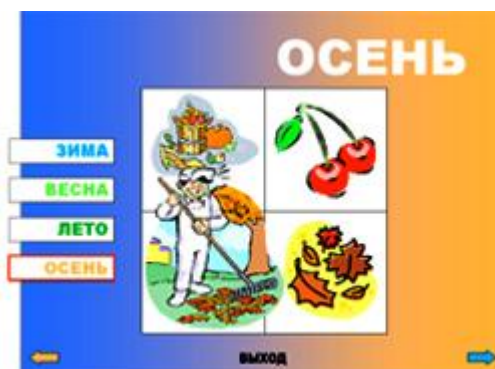
Рис.5. Слайд 5.