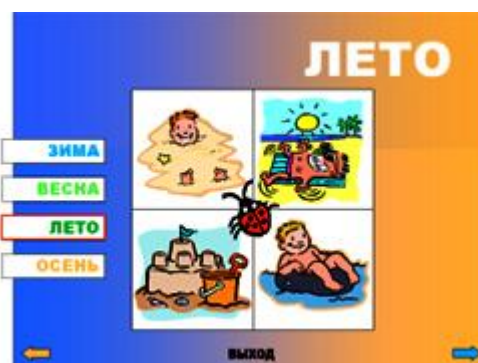
Рис.4. Слайд 4.