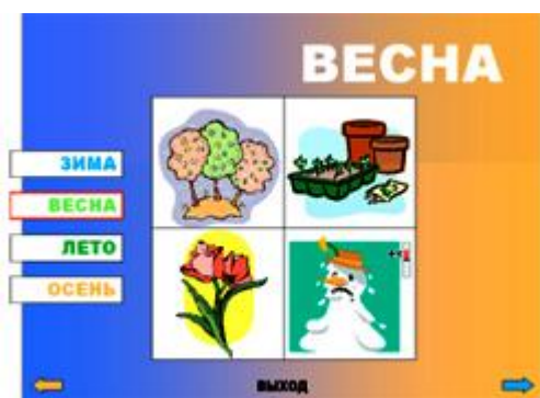
Рис.3. Слайд 3.