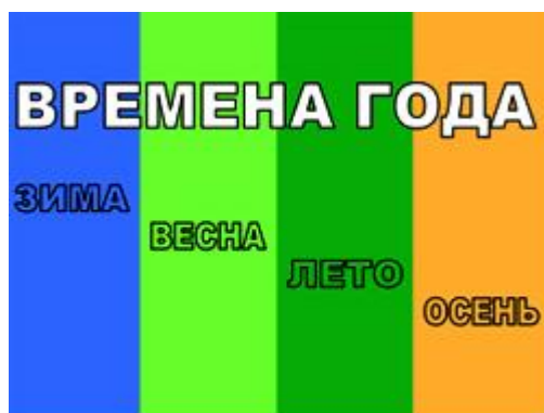
Рис.1. Слайд 1.